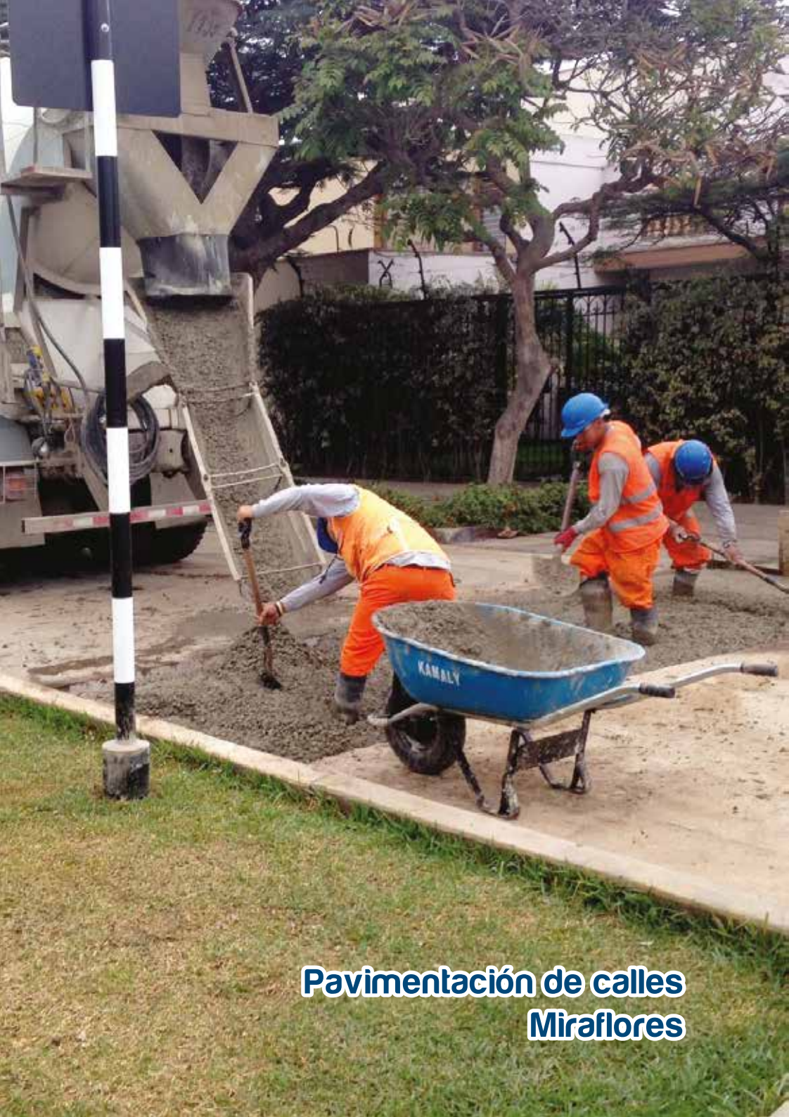
Pavimentación de calles Miraflores